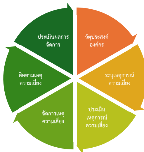
ภาพที่ 1 ขั้นตอนการจัดทำแผนบริหารความเสี่ยง

สถาบันดนตรีกลายาณิวัฒนาดำเนินการตามขั้นตอนการบริหารความเสี่ยง โดยเริ่มจากการกำหนดวัตถุประสงค์ พิจารณาระบุความเสี่ยง ประเมินโอกาสและผลกระทบของแต่ละความเสี่ยง ออกแบบการบริหารจัดการความเสี่ยง ติดตามการดำเนินงาน และประเมินผลการดำเนินงาน