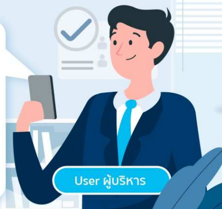
User ผู้บริหาร